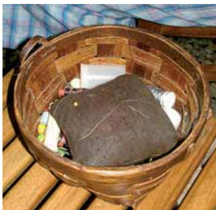
► JOSTO-ZAREA. Jostozarea bere osagarriekin. (AA, 2005-06-04)

Jósi: I. ad. Josi, oihala josi./ Josiko iñat ori. Josiko dinat hori. (JBA, 2000-10-21)/ Josten. Josten. (JBA, 2004-04-17)/ Josten-da itteko. Josten-eta egiteko. (JUA, 2004-08-29)/ Josi. Josi. (JBA, 2005-02-19)/ 2. ad. Hiltzez lotu./ Teillatuko egurre josten. Teillatuko egurra josten. (JBA, 2002-08-25)/ Josteko. Josteko. (Iltzeen bidez, sarea eta hesola lotzeaz ari da) (JBA, 2001-04-28)/ Entenga direlako iltze handiekin egurra josi egiten da. (JBA, 2002-08-25)/ 3. ad. Josi,