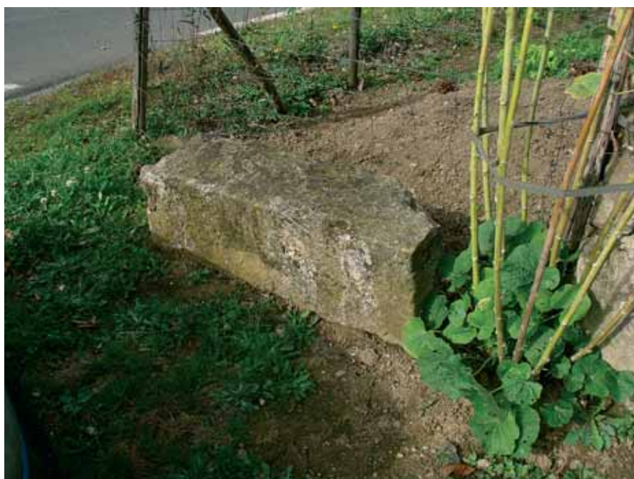
› JARLEKUE. Harrizko jarlekua. (AA, 2008-10-12)