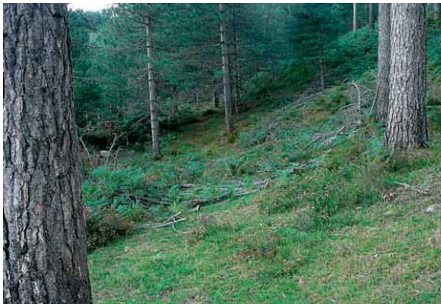
► JENTILLEN BOLALEKUE. Jentillen Bolalekue delako tokia. (AA, 2005-09-09)

► Grab. Aiztona: “Jaztetxea da ba lenao iz-