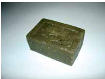
› JABOIA. Xaboa. (AA, 2008-12-07)

JABE IN: ad. Jabe egin, jabetu./ Etxe orren jabe in tzien. Etxe horren jabe egin ziren. (JUA, 2000-12-16)