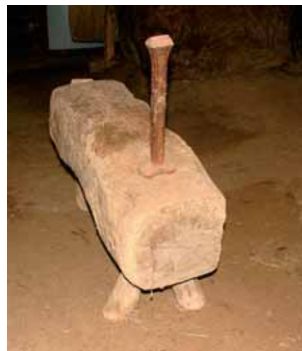
► JUNGUREA. Segak pikatzeko ingudea. (AA, 2008-03-15)

JUN DAN: Joan den, denboraz mintzatzean erabiltzen da./ Jun dan bi eun oitako baten. Joan den bi egun horietako batean. (JBA, 1998-11-07)/ Jun daneko bost urtean. Joan deneko bost urteetan. (Azken bost urteen gainean esana) (JBA, 1999-12-04)/ Jun dan aldiñ ez. Joan den aldiñ ez. (JUA, 1999-02-10)/ Jun dan emetan. Joan den egunetan. (JBA, 1999-02-10)/ Jun dan urten. Joan den urtean. (Ihaz) (JUA, 1999-