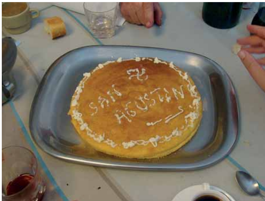
› JAKIE. Postrea. (AA, 2008-08-31)

Jaitsialdi, jaitsialdie: iz. Jetzialdia./ Jaitsialdi oikin. Jetzialdi horiekin. (Ardien gainean) (JBA, 2005-04-30)