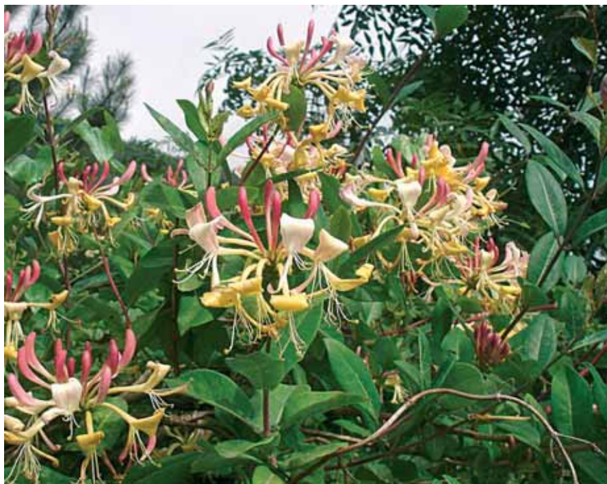
► JESUKRISTON-ATZAPARRAK. Izen bitxia dute landare hauek. (AA, 2006-05-27)