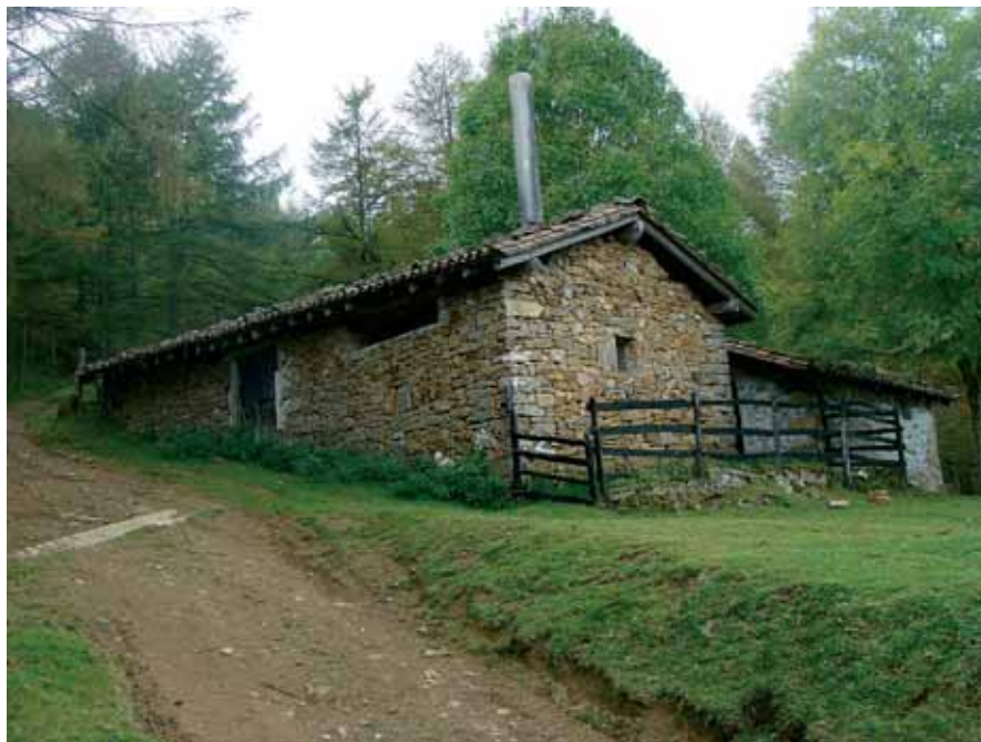
› JAONDO. Jaondoko txabola. Jaondoko txabolak areharrizkoak dira. Gorago dauden Arriurdingoak berriz, ka-reharrizkoak. (AA, 2008-10-12)

Jarein: ad. Jaregin, askatu./ Jareñ. Jaregin. (Baseri barnean dauden behorren gainean)/ Jarein. Jaregin. (Landareak urreztatzeke iturria irekitzeko esanaz) (JBA, 1999-07-03)/ Jarei ozu alde ontati. Jaregin