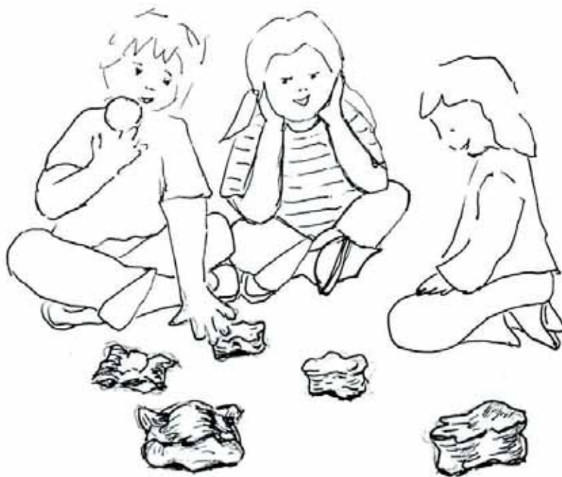
► JOLASA. Umeak tortoloxketa jolasean. (Maria Jesus Ugalde, 2008)

"O sea", alde bateti etzuen letraik eukitzen, ta besteti propagandakoa-o, (...). "Pan y vino", "pan o vino". Ta ura zeiniek (...) tzon ba, mutikok ala ibiltzen tziñ. Pelotea-ta, futbolik etzeon ordun arten, futbolik etzeon. Gaiñeakon, ori beintzel". Tortoloxketa zer zen: "Tortoloxakiñ... Arkumeik ez gendun jango-ta... Tortoloxak gutxi izango zien, ez gendun, bakitt (...) itten tzana, bai. Geure tortoloxakin, koloretan pintau-ta, gutxi izate... Ez, orta ez gendun". Kalderonketa ere bazen: "Bai, kaldeonketea eitten tzan, baiño ori garizumakoa zan... Bai, garizuman bakarrik, bai. Ori garizuman, ze gauzea, e! Eta eitte gendun, or gaiñea Brinkolatik kruzeraora juten da ba, kruzerao jakingo dezu goititik gero Teillartea... an eitten gendun kamiñon. Karo, bestela noa jun, da kamiñon. Oaiñ ainbat kotxe etzan ibiliko, bat etzan pasauko-ta, an kaldeonketan, ori bai. Jaietan bakarrik ori eitte gendun. Ta gaiñeakon ze esango izul" (MUA, 2003-10-10)